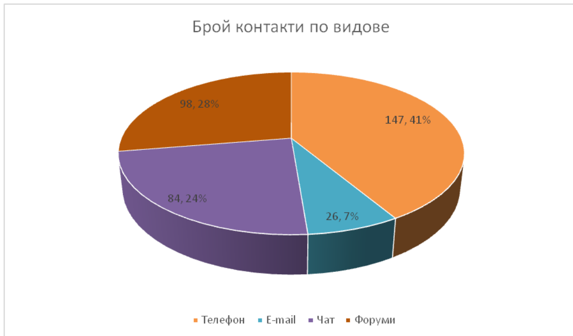
Графика 1 . Контактите, осъществени в двата форума, не фигурират в останалите таблици и статистика, освен в таблицата за „Брой контакти по видове”.